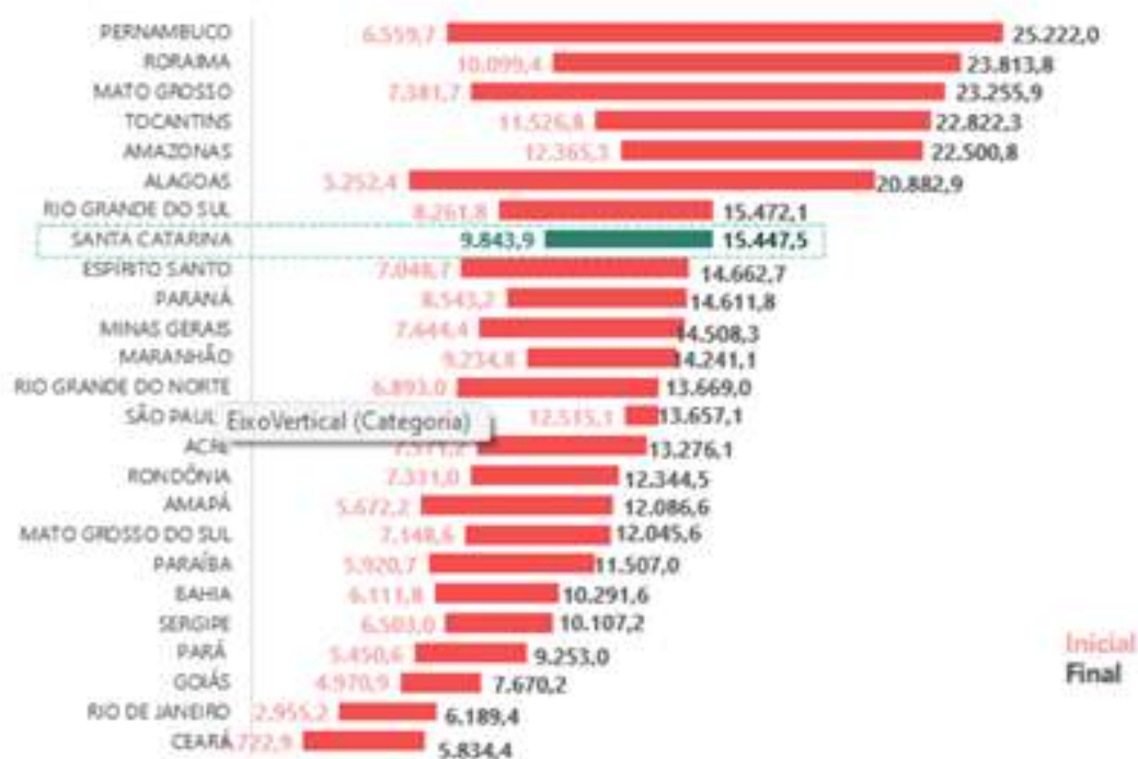
Figura 8 - Fonte: documento elaborado pelo Sindicato

Com base nas informações apresentadas, é essencial o olhar da direção do órgão para minimizar as disparidades salariais e promover a valorização adequada dos servidores do Poder Judiciário do Estado de Santa Catarina.