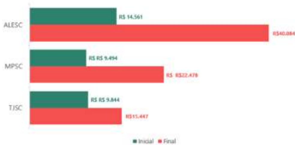
Figura 6 - Fonte: documento elaborado pelo Sindicato

Além disso, considerando o alto nível de competência das unidades administrativas, evidenciado por dados, capacitação, conhecimento, habilidades e atitudes durante a inspeção administrativa, é notável a discrepância salarial em comparação com os tribunais estaduais.