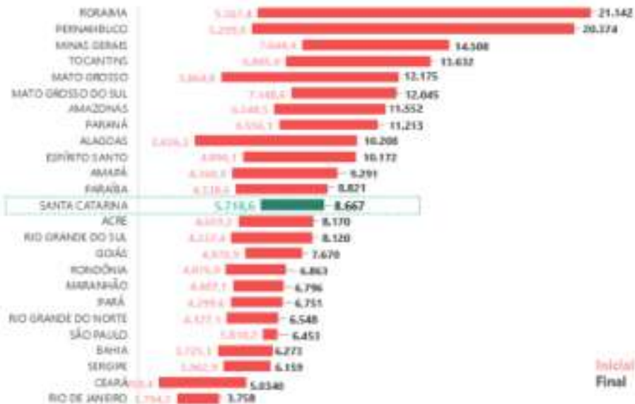
Figura 7 - Fonte: documento elaborado pelo Sindicato