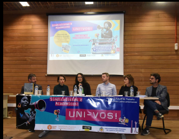
Lançamento das cartilha e do livro na UFSC - 05/2023