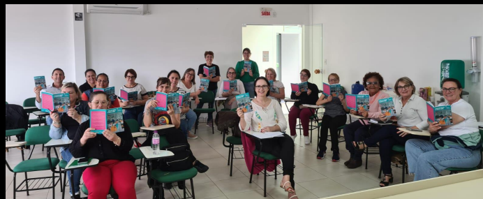
Formação feita para o SINTE na cidade de Campos Novos (SC)