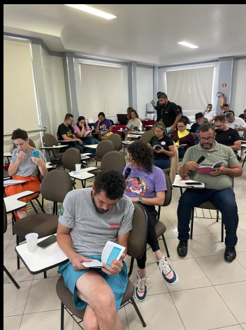
Formação feita em parceria com a FENAJUD na cidade de Macapá (AP) - 07/2023